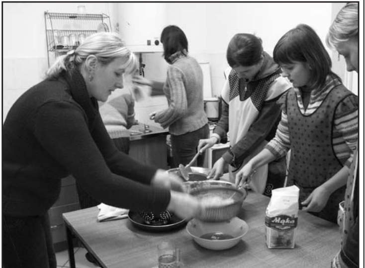
Gotowanie w Bielicznach

Kolejne spotkania kulinarne odbędą się w kwietniu i maju w Zelgnie i Bielicznach.