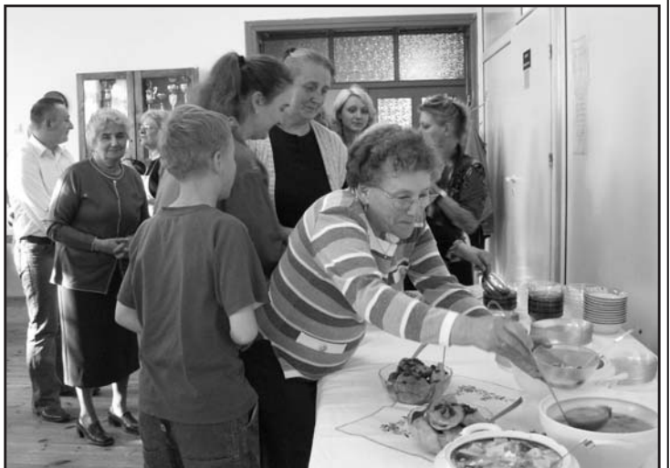
Degustacja w Zelgnie